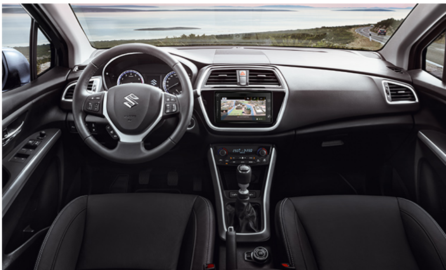
Das Innenraumbild zeigt die höchste Ausstattungslinie