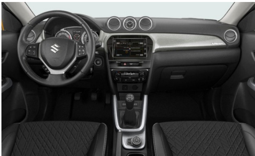
Das Innenraumbild zeigt die höchste Ausstattungslinie